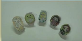
ほかにもたくさんつくってみてね!