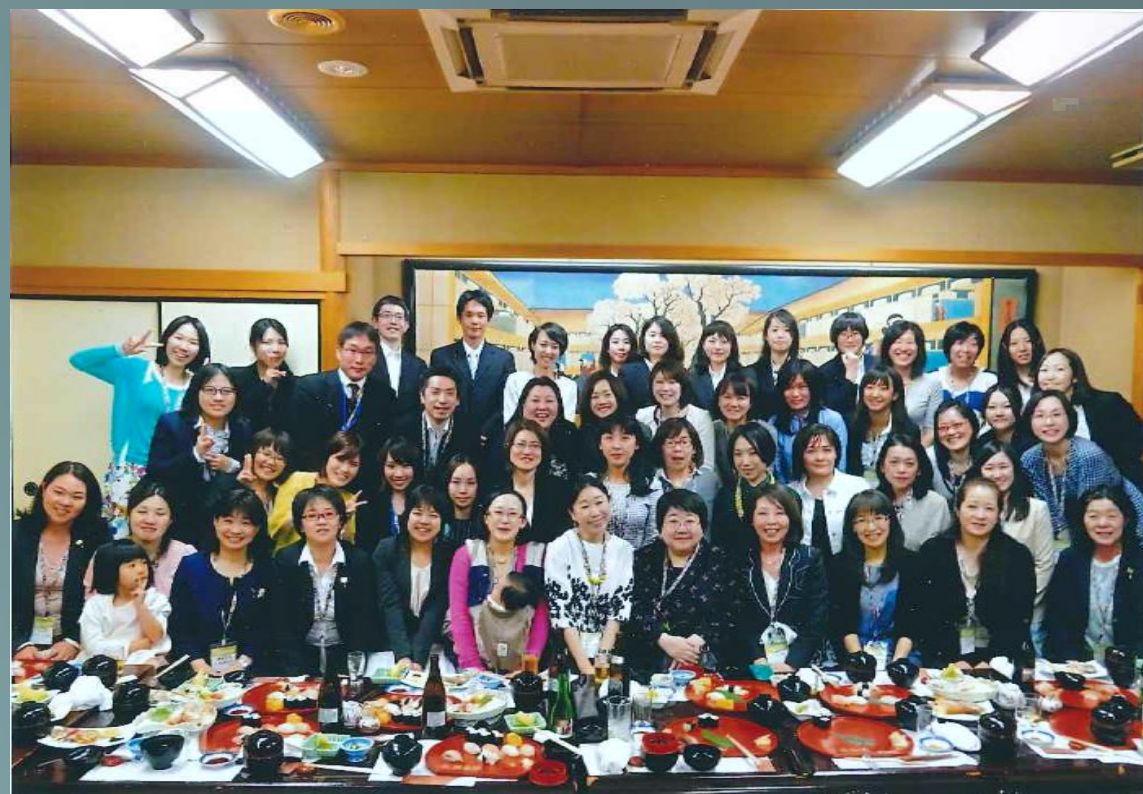
2015年5月 日本泌尿器科学会総会 女性泌尿器科医の会 当科入局者および入局予定者数名が参加しました

当教室は女性医師を全力でサポートします。しかし、これは今の時代当たり前 当教室では 女性医師と結婚し 妻と子供に頭のあがらない男性医師 も全力でサポートします。