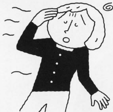
身体がよれる、後ろに引き込まれる、流れるなどめまいの訴えはさまざま

ある病院の統計では救急患者の67%はめまいで、誰もがなり得る病気です。目がぐるぐる回る回転性、体がふわふわふらつく浮動性、眼前景暗感、動揺視などさまざまに分類されますが、患者さんが訴える症状は身体がよれる、後ろに引き込まれる、流れるなど一概に判別できない病気です。詳しく問診して原因を探り、めまい発作時